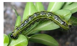
Pyrale du buis

Les rameaux envahis par les pontes doivent être coupés et évacués dans des sacs poubelles afin d'être ensuite incinérés.